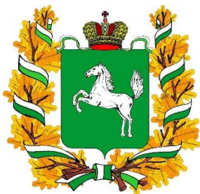
Администрация Томской области